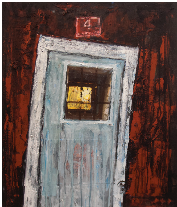
Brez naslova, mešana tehnika na platnu, 60 cm × 50 cm, 2014

večinoma tudi naslika, kar je doživel in podoživel v resničnem svetu. Kakor da gre za obliko sočutja in razumevanja sveta ali morda za iskanje ljubezni in odrešitve. Struktura kompozicije posameznih slik je izredno pomembna prvina njegovih del, zato ji namenja vso svojo pozornost. Posebej skrbno neguje strukture v témah, ki so posvečene skoraj neopisljivim vizijam, skozi katere se na nenavaden način pretaka svetloba. Njeni magični moči slikar do kraja zaupa in jo v svojih podobah neguje kot največjo dragocenost. V kompozicijskem in vsebinskem smislu materializiran odnos med figuro in abstrahirano pokrajino, med