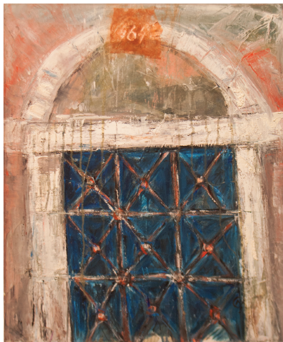
Brez naslova, mešana tehnika na platnu, 70 cm × 55 cm, 2013

rozet in vitražev do profano izslikanih vrat s povsem banalnim napisom Prepovedno parkirati. A vse so brez življenja, notranjost je zaprta, a zunaj se nič ne dogaja.