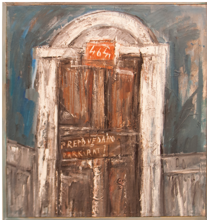
Brez naslova, mešana tehnika na platnu, 75 cm × 70 cm, 2013

Institut "Jožef Stefan", Ljubljana, Slovenija