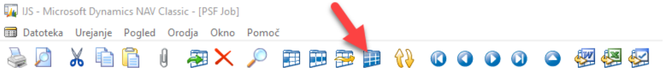
Slika 8: Projekti – Umik filtra

Skrbnik lahko ob umiku filtra prikaže vse projekte in s tem lažje nadzira njihovo planiranje.